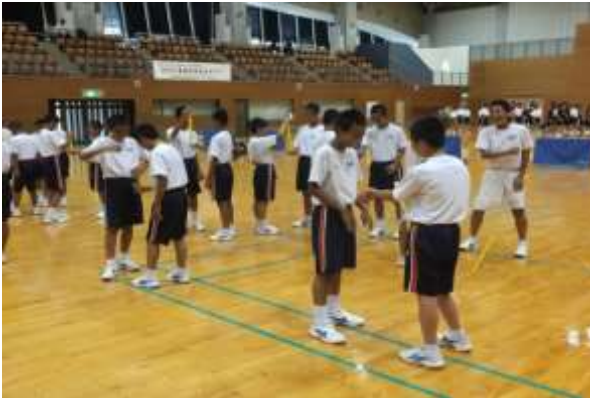
反応トレーニング