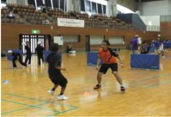
クイックネストレーニング