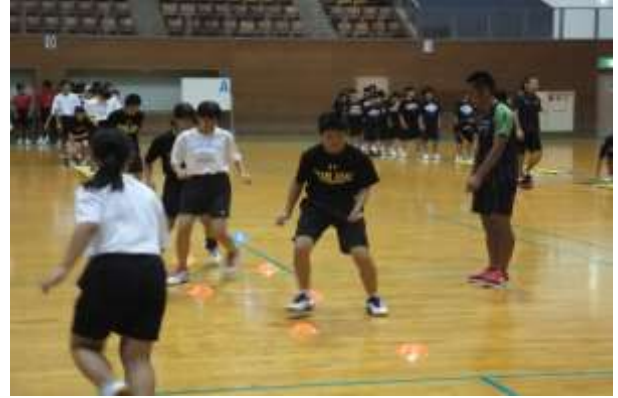
アジリティトレーニング