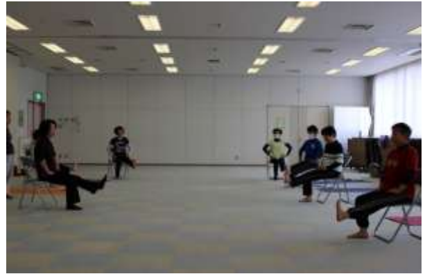
健康フィットネス教室