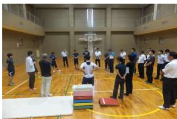
跳び箱（市内小学校教員研修）